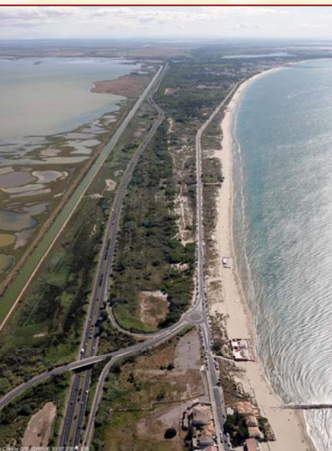
Le Golfe d'Aigues-Mortes